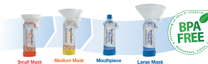
Small Mask Medium Mask Mouthpiece Large Mask